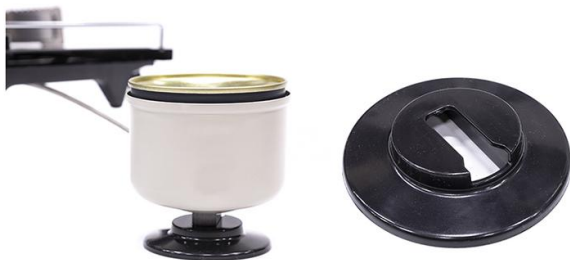
▶ 가스용기 거치대(HOLDER)

OD缶ホルダーになります。 気温が低い時にご使用ください。 （零度以下の時にガスの燃焼が良くなります。）